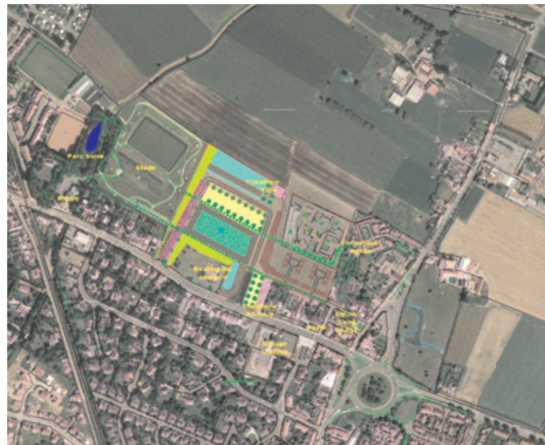
Situation aérienne du projet de réaménagement du quartier de la mairie

Les 2 associations ont écrit ensemble le dossier qui a été présenté aux instances publiques par l'Afeji au nom de l'association Noémi.